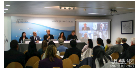
Presseclub Brüssel Europa