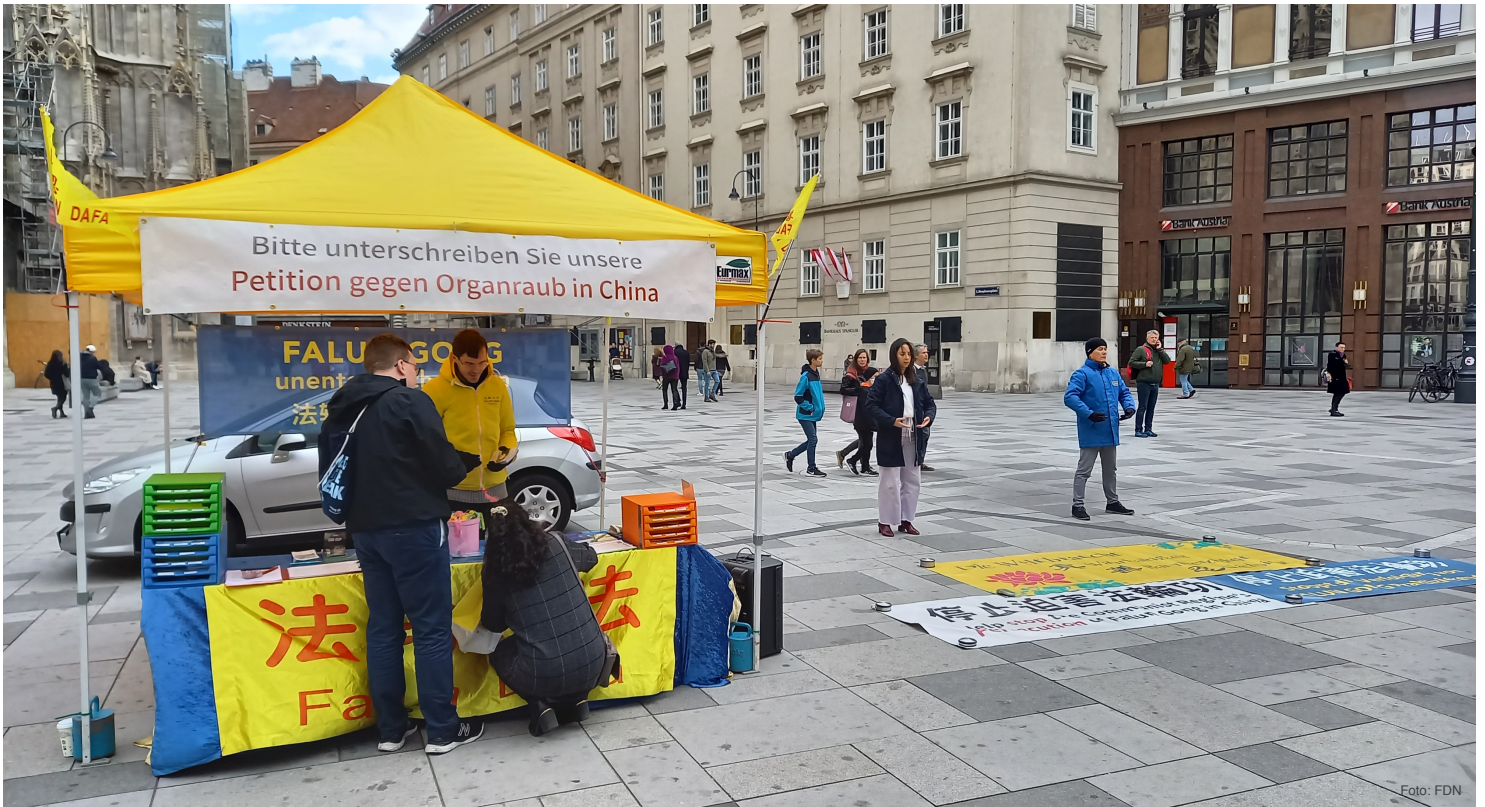
Kundgebung am Stephansplatz in Wien am 23.10.2021