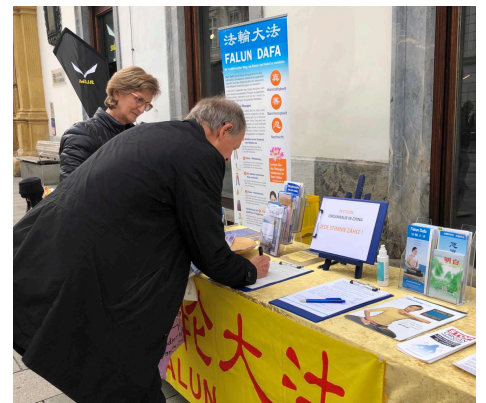
Kundgebung in der Grazer Herrengasse, am 23.11.2021

Einige Passanten sind nach einiger Zeit wieder zurückgekommen, nachdem sie den Falun-Dafa-Flyer selbst in Ruhe studiert hatten, und setzten ihre Unterschrift auf die Petition.