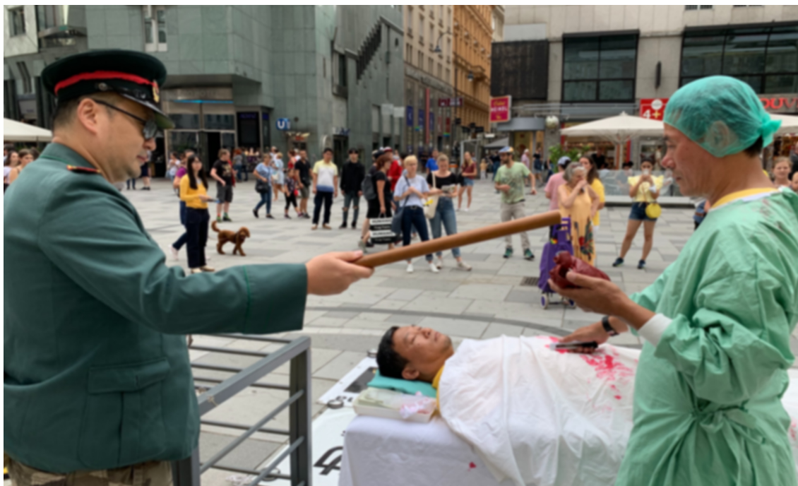
Organraub Nachstellung, Stephansplatz, Wien