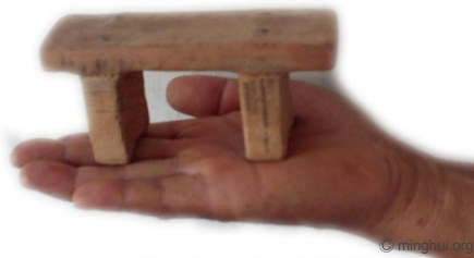
Ein derartiger winziger Hocker wird genutzt, um Falun-Dafa-Praktizierende zu foltern.

Einmal warfen die Angehörigen einer Praktizierenden dem ehemaligen Gefängnisdirektor Yang Mingshan vor, dass man